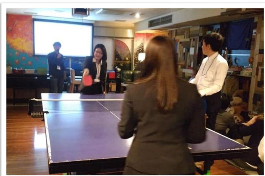
恒例の卓球バーでLT大会