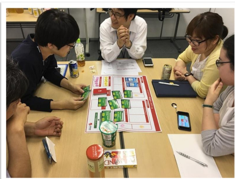
ボードゲームで楽しくセキュリティを学ぶ