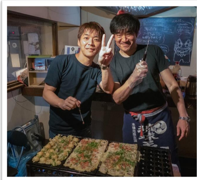
関西といえばたこ焼き